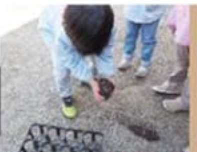
土、こぼれちゃった...